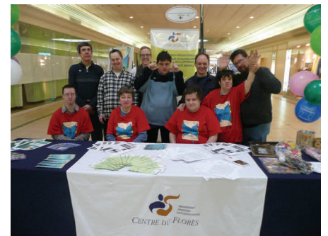
Équipe du kiosque de sensibilisation aux Galeries des Laurentides

Les spectateurs étaient nombreux à assister au spectacle de variétés organisé en collaboration avec les partenaires de Thérèse-De Blainville. Animée par le comédien Étienne Pilon et sous la présidence d'honneur de Gabriel Laberge, la soirée fut riche de talents alors que plusieurs personnes ayant une déficience intellectuelle sont montées sur scène.