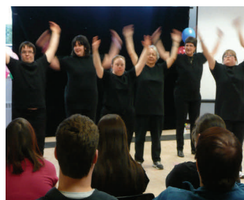
Spectacle de danse à la maison du Citoyen de Sainte-Thérèse

Les étudiants de la polyvalente Deux-Montagnes ont reçu la visite d'un jeune étudiant ayant participé à l'activité de jumelage avec une personne DI. Son expérience ainsi que le témoignage d'une personne DI et d'un membre du comité ont été appréciés des étudiants.