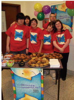
Muffins préparés par les personnes ayant une DI

C'est plusieurs moments de partage qu'a réussi à créer l'équipe de Mont-Laurier avec la distribution, à la Polyvalente St-Joseph, de rubans et de muffins préparés par des personnes ayant une DI. Ensuite, une présentation sur les intérêts et capacités d'une personne ayant une déficience intellectuelle a été donnée devant des élèves de l'école Sacré-Coeur de Ferme-Neuve.