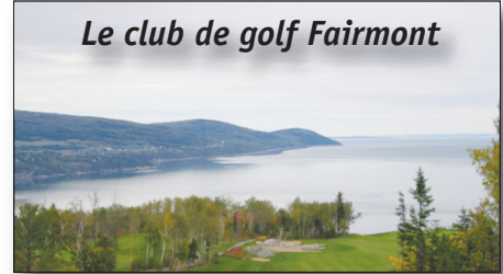
Le club de golf Fairmont